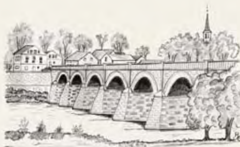
Die Backsteinbrücke von Kuldīga

Die Kleinstadt gilt in der Region als Touristenmagnet. Es sind die europaweit längste befahrbare Backsteinbrücke und der mit seinen 249 Metern breiteste Wasserfall, die die Touristen anlocken. Aber auch ein Besuch der Altstadt mit der Kirche und den historischen Gebäuden aus dem 17. und 18. Jahrhundert ist sehr zu empfehlen. Für die Altstadt und die Ziegelbrücke sind die Aufnahme in die Liste des UNESCO-Welterbes beantragt.