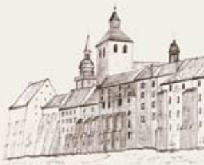
Die Wehrspeicher am Wassertor

In das Zentrum von Grudziądz/Graudenz führt der R1 nun auf einem neuen straßenbegleitenden Radweg entlang der 55. Einige Meter hinter der Wiejska Straße biegt der Weg in Richtung Wisła/Weichsel ab, wir durchfahren kurvenreich eine Wohnsiedlung und sind schon bald auf dem Panoramaweg am Fluß. Auf diesem Weg, später auf einer Straße, kommen wir in die Nähe des historischen Stadtkerns und zur Touristinformation. Dem schließt sich ein nettes Wegstück an einem Kanal an, bevor es dann über die Bema und Fortezna Straße wieder stadtauswärts geht.